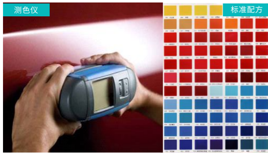
1 测色仪生成精准配方